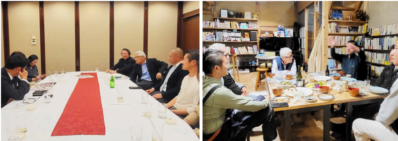
如水会館の菊の間にて「文化交流」など 当宿で淀江の未来を語り合う について意見交換

見せてもらえませんか？」 お二人が次の予定があるということで、短い時間でしたが、「古代淀江ロマン遺跡回廊」推進会議の活動のお話などをお聞きし、私も宿を立ち上げるまでのストーリーなどをお話しながら宿の中をご案内し、2022年4月15日に設立した Bisui Daisen が5月末に実施した外国人のサイクリングモニターツアーのアンケートをまとめた資料をお渡ししました。その後、Facebook やり取りが始まりました。