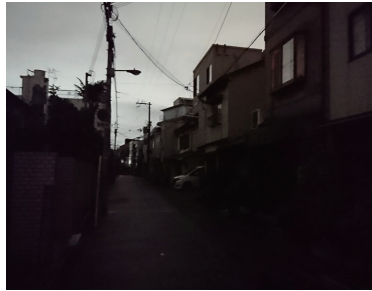
街灯も消えて真っ暗な自宅周辺