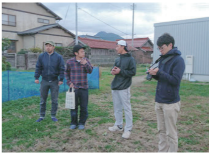
訪ねてくれたメンバーと近くの「メイちゃん農場」も見学