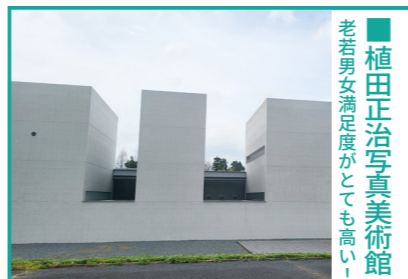
植田正治写真美術館 老若男女満足度がとても高い！

植田正治は世界でも注目された日本人写真家のひとり。建築家・高松伸設計による館内からは水面に映る「逆さ大山」が楽しめる。