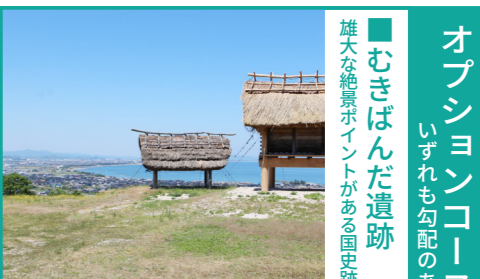
むきばんだ遺跡 雄大な絶景ポイントがある国史跡

観光客が訪れる人気の湧き水で、鳥取県の「因伯の名水」にも指定されている。鳥取県西部で唯一、亜熱帯植物「クリハラシ」が自生。